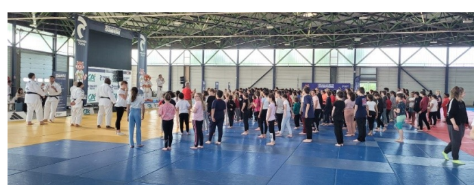
Le hall des expositions de Vierzon et les élèves des écoles primaires