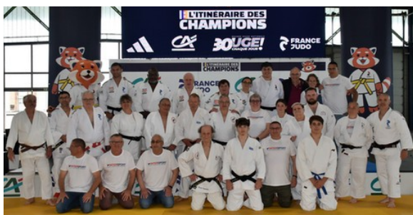
Les bénévoles impliqués dans la réussite de cet événement.